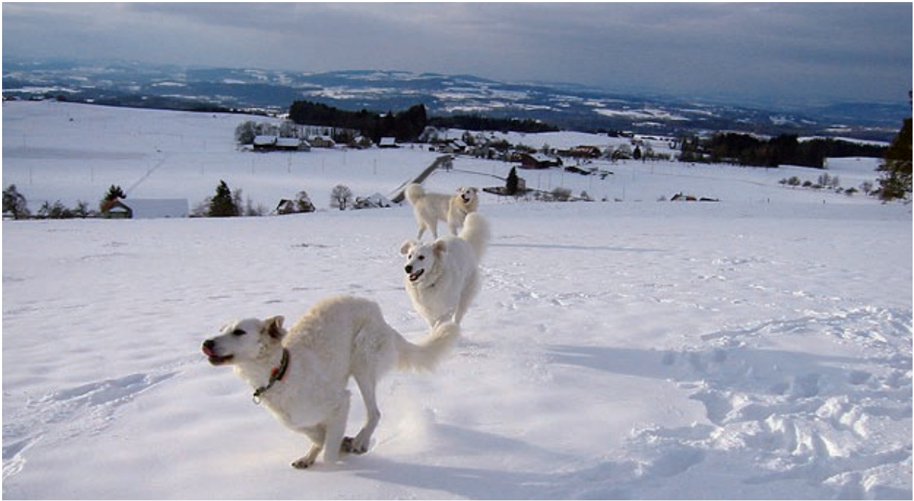
Ist das nicht ein herrliches Bild? Fanny, Duna und Merlin vergnügen sich im Schnee.

Kann ein Treffen von Clubmitgliedern und Kuvaszok perfekter sein? Wohl kaum. Knallblauer Himmel, Sonnenschein, frischer Schnee, gut gelaunte Stimmung, was will man mehr?