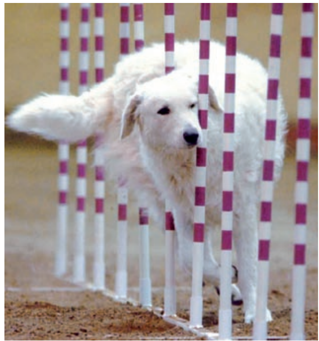
Aussergewöhnlich für Kuvaszok – Agility. Temes in Aktion.